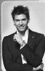
grafika Zdeněk Štídlák

soutěže pro děti a dospělé, skákací hrad, zvířátka, malování na obličej, dílničky pro děti, projížďka na segway vozítku, eko jarmark dary naší země, ukázka starých řemesel, výstava hasičských a popelářských vozidel, nádobí na odpady, výstava starodávných loutek, projížďka na koních a ponících